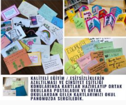
KALİTELİ EĞİTİM / EŞİTSİZLİKLERİN AZALTILMASI VE CİNSİYET EŞİTLİĞİ KONUSUNDA KAYITLI VE KAYITLI OLMAYAN OKULLARA POSTALAR VE ORTAK OKULLARDA EĞİTİM KATILIMINI OKUL PANOSUNDA SERGİLEDİK.