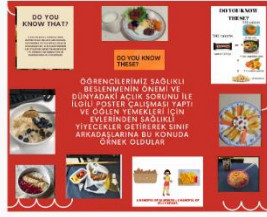
DO YOU KNOW WHAT? DO YOU KNOW THESE? ÖĞRENCİLERİMİZ SAĞLIKLI BESLENİMİN ÖZÜNÜ VE DÜNYADAKİ AÇLIK SORUNU İLE İLGİLİ YERLERDE ÇALIŞMAYI YAPTI VE ÖĞLEN YEMEKLERİ İÇİN EŞİTSİZLİKLERİ İÇİN TİVEÇEKLE GETİREREK SINIF AKRABALARINDA BU KONUSUNDA ÖRNEK OLDULAR