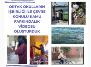
ORTAK OKULLARIN İŞBİRLİĞİ İLE ÇEVRE KONUSUNDA FARKINDALIK VİDEOSU OLUŞTURDUK