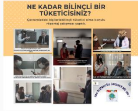
NE KADAR BİLİNCİLİ BİR TÜKETİCİSİNİZ? Çevremizdeki tüketilebilirlik tüketici olma sorunu üzerine farkındalık yarattık.