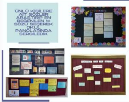
GÜLÜ KİŞİLERE AIT SOZLEŞİMLERİ BEĞENEN İNŞİ BÖLGEDEKİ OKUL PANOSUNDA SERGİLEDİK