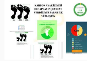
KARBON AYAK İZİNİZİ HESAPLAYIP ÇEVREYE VERİLEBİLİR ZARARLI VE YAZIŞTIRDIK Carbon Footprint