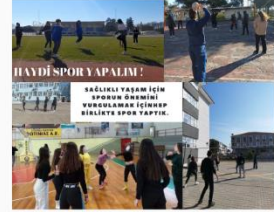
HAYDİ SPORA GELİM! SAĞLIKLI YAŞAM İÇİN SPORUN ÖNEMLİ BİR KISIMINI YERELLEŞTİRMEK İÇİN BİRLİKTE SPORA GELİYİZ.